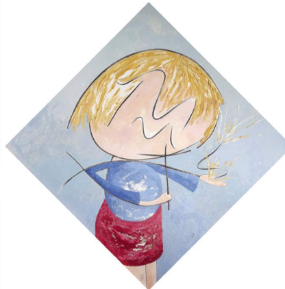
Het Kruis en het Licht